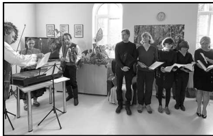
Pěvecký sbor zpíval v Diakonii