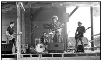
Sborový den s rockovým koncertem