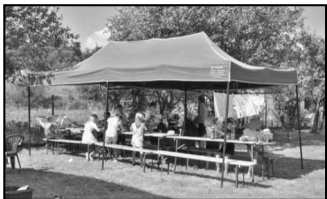
Letní příměstský tábor