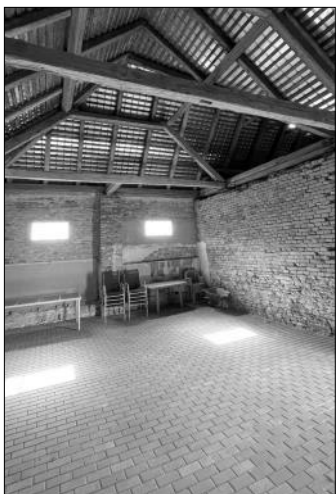
Úprava stodoly pro společenské využití