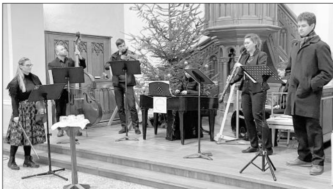
Vánoční koncert cimbálové muziky Aldamáš